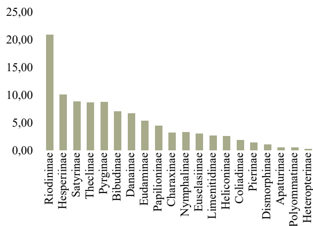
Figura 3. Porcentaje de número de especies por subfamilia de Lepidópteros en el área de estudio