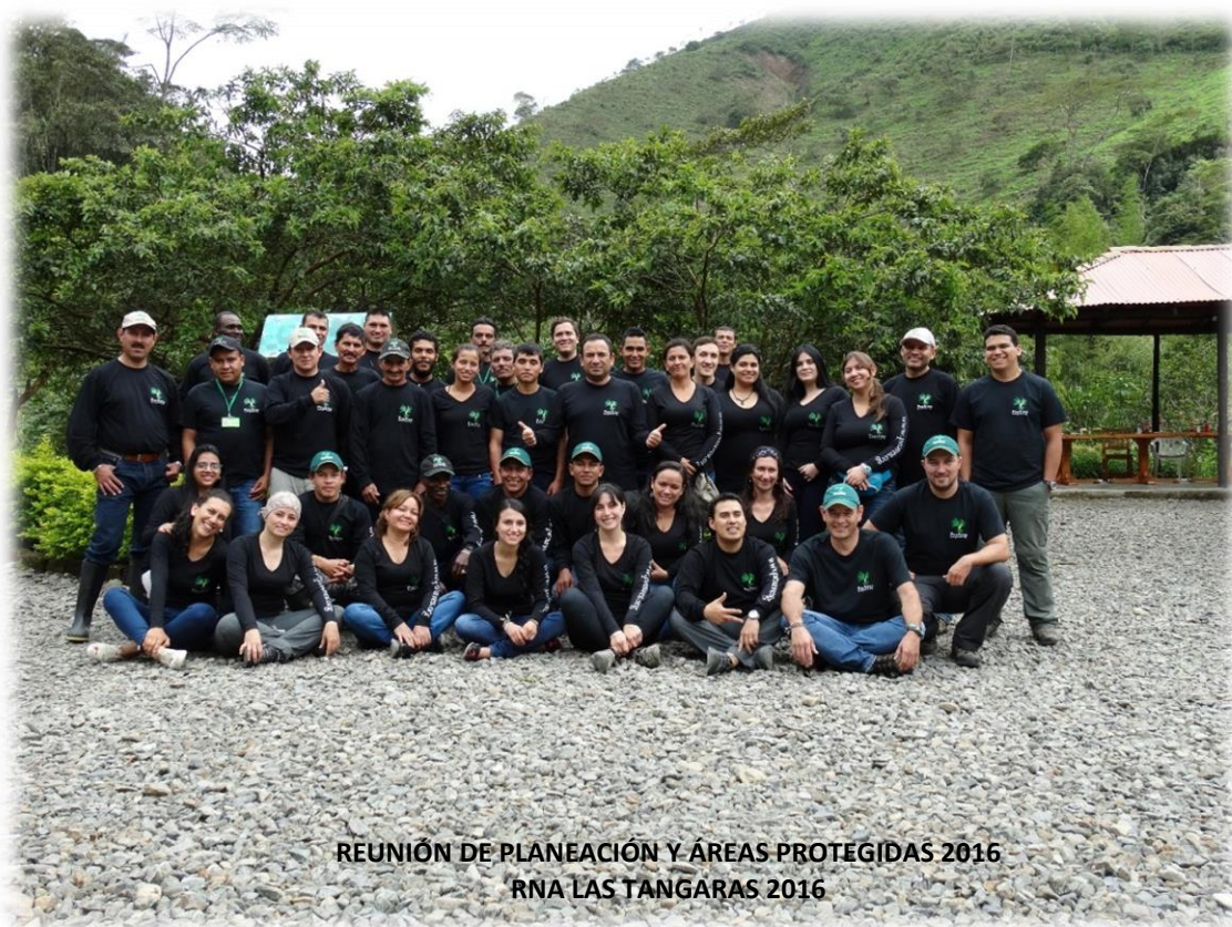
REUNIÓN DE PLANEACIÓN Y ÁREAS PROTEGIDAS 2016 RNA LAS TANGARAS 2016